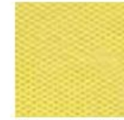
Gia. limone 8