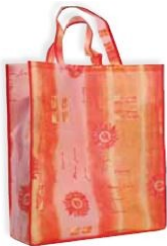
MODELLO DE MEDICI