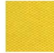
Gia. ocra 7