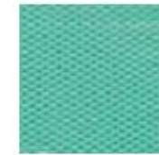
Ver. hospital 17