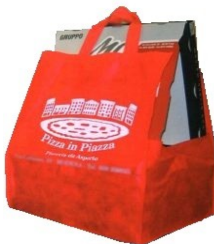
MODELLO PORTA PIZZA