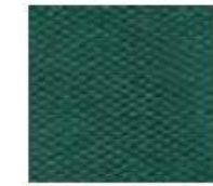
Ver. bottiglia 18